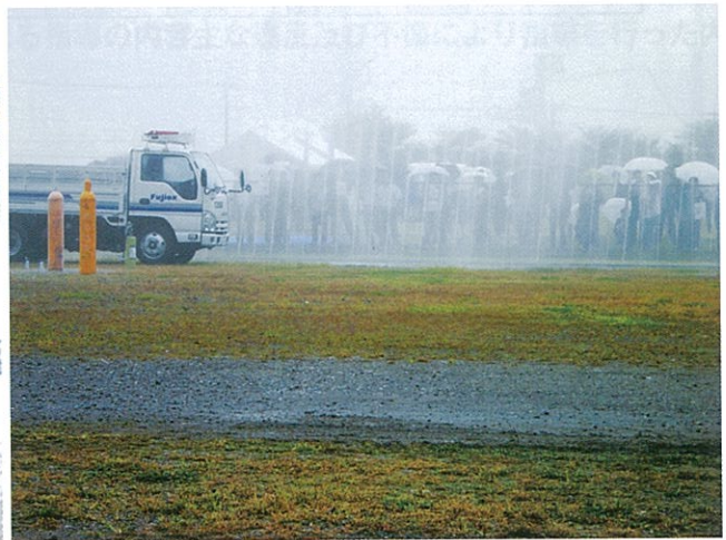
訓練風景(塩素ガス拡散防止用噴水カーテン)