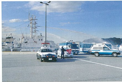
運送途上におけるガス漏えい緊急措置訓練風景