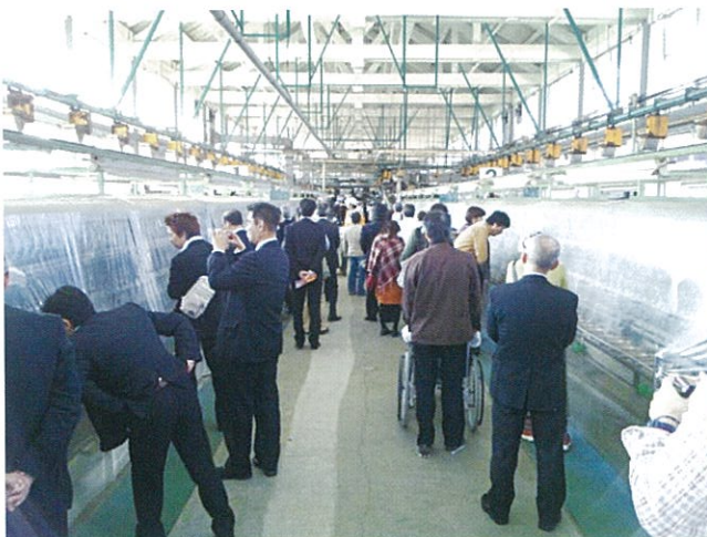
富岡製糸場(繰糸場内部) 見学風景

訓練会場は、液化酸素燃焼爆発実験の実験再開を考慮しアスファルト舗装施工のない坂戸・鶴ヶ島下水道組合石井水処理センターで行われた。生憎の雨模様で気温も例年よりかなり低い状況での訓練であり、「災害は時と場所を選ばず」とは言え实际的、実践的な訓練の実施は、ハードルの高いものである事を再認識させられた視察でもあった。なお、2日目は足利学校、富岡製糸場等の他2施設を見学し24年度研修見学会を無事終了した。