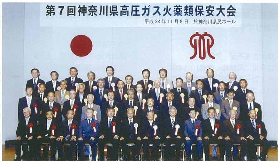
県知事・団体会長表彰受賞者のみなさん