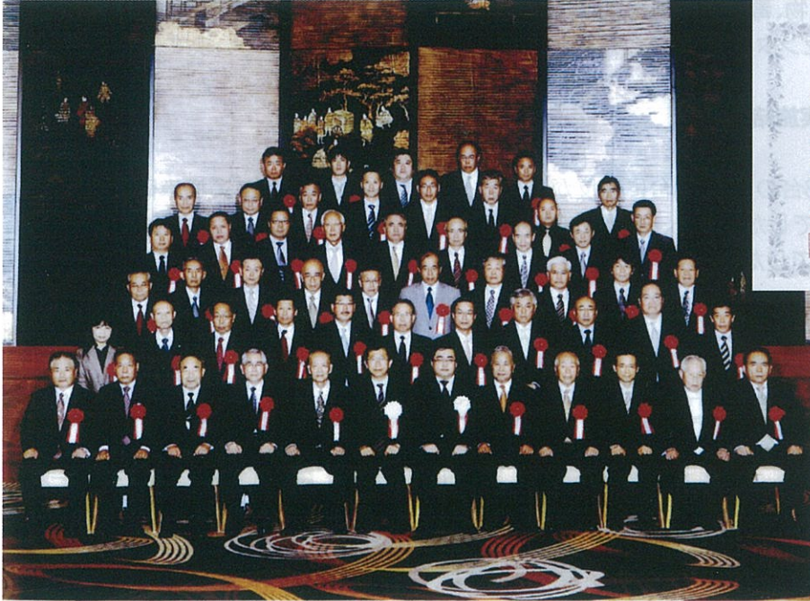
平成25年度 高圧ガス保安経済産業大臣表彰記念 25.10.25 於 ANAインターコンチネンタルホテル東京

同氏は平成4年6月当会理事に就任、平成14年6月に至る10年間に於いて高圧ガスの移動に係る安全・技術の確立に寄与し、後の副会長及び移動部会長の任にあつては、協議会が掲げる目的の「災害の発生とその拡大防止」に係る事業の発展に大きく貢献したことが認められたものです。