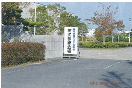
防災訓練会場 (正面)

静岡県が開催する防災訓練には、過去に何度か研修見学先として訪れていますが、県面積が広いことから県内を16地区に分けて輪番で実施しているとのことであり、その内容や運営方法も地域特性を十分に反映させるため、時には訓練の事前打合せが二桁回数に及ぶことがあると聞いています。