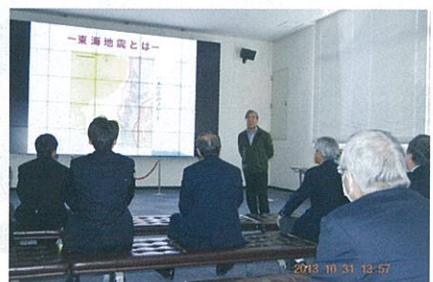
静岡県防災センター