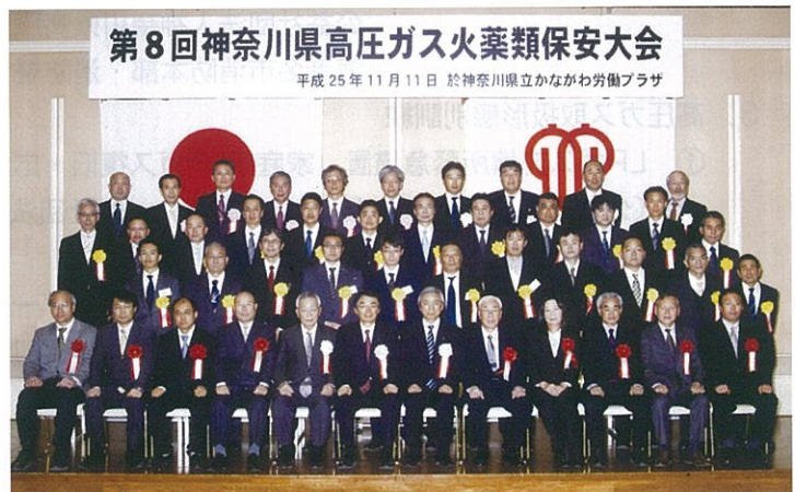
県知事・団体会長表彰受賞者のみなさん