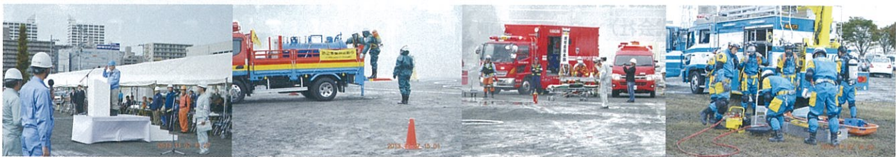
小谷会長 閉会挨拶