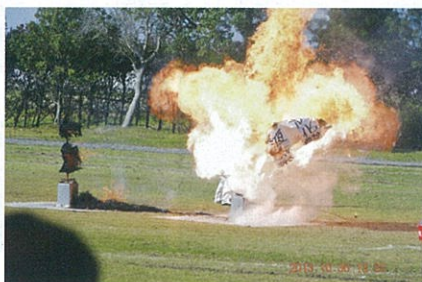
液化酸素燃焼試験