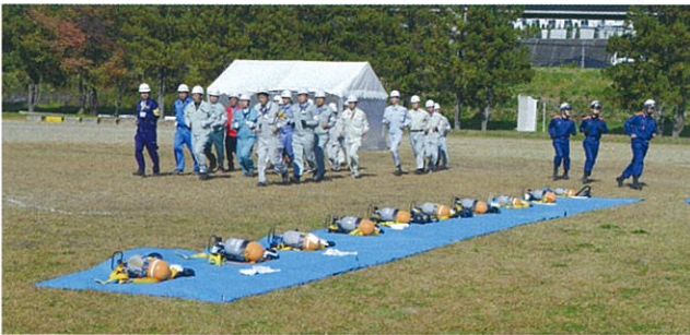
空気呼吸器装着訓練