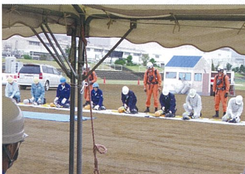
空気呼吸器装着訓練