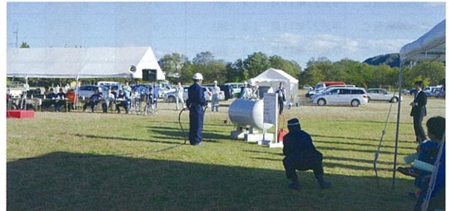
バルクローリー移動基準訓練