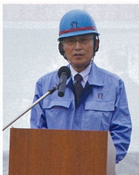
布施会長閉会挨拶