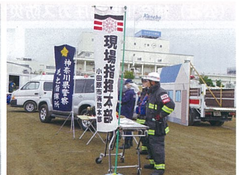
現地指揮本部・指揮隊 (消防・警察)