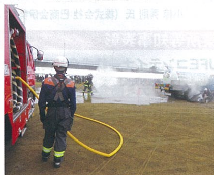
LPガス拡散防止散水