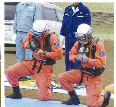
空気呼吸器装着訓練